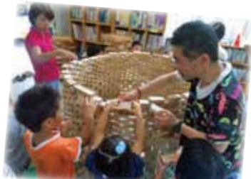
つみきのそのさん