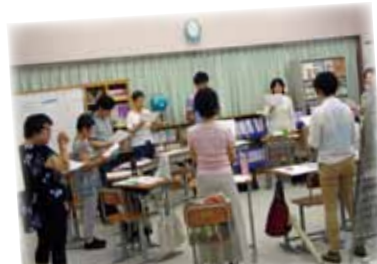
NPO 法人ヒューマンケア支援機構