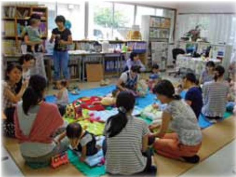
NPO 法人 place of peace

H26年4月にスタートしたコミュニティカフェ。 この3月をもって『place of peace』さん、 『ヒューマンケア支援機構』さんが卒業します。長い間運営して下さいました 団体のみなさん、ご参加下さったみなさん、ありがとうございました。 4月から新たに、1階オープンスペースでコミュニティカフェを主催、 運営して下さいる団体さんを募集しています。週1回でも、月1回でも構 いません。団体の活動をより多くの方に知ってもらう機会として、新し い出会いの場として、是非ご活用下さい。コミュニティカフェについて のお問合せは、スタッフまでお気軽にお声かけ下さい。